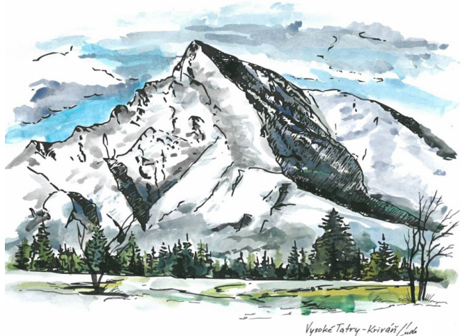
Vysoké Tatry - Kriváň/Lada

A tak vám tu teraz vravím, že za svoj národ sa nehanbím. Veľ aj ja som sa tu narodil, nerád bych vlasť za hlavu zahodil.